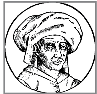
Josquin des Prez

Ftit mużiċisti laħqu l-fama u l-influenza ta' Josquin des Prez (ca. 1450-1521) . Il-mużika ta' Josquin kienet stampata jew ikkupjata f'manuskritti fuq skala ġdida għal żmienu. Hu serva